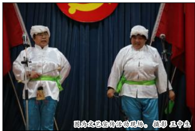
图为文艺宣传活动现场。

本报讯 3月27日,生活服务中心举行“践行群众路线 对标赶超发展”文艺宣传活动。员工们利用喜闻乐见的文艺演出形式,道出了党的群众路线教育实践活动的实质内涵及山西铝厂、山西分公司职代会和党建会会议精神,为更好地搞好各项服务和完成经营目标任务加油鼓劲。